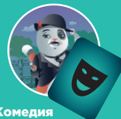
Комедия — Маски