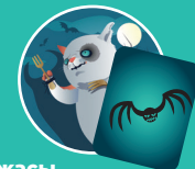
Ужасы — Летучая мышь