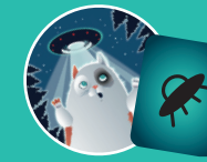
Фантастика — Летящая тарелка