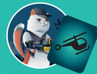
Боевик — Вертолёт

Чтобы стать победителем, недостаточно просто быстро кидать карты. Выиграет тот игрок, который правильно подберёт аксессуары к жанрам кино. Как написано здесь: