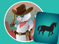
Вестерн — Лошадь