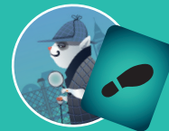
Детектив — Следы